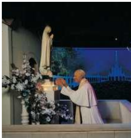
Svatý Otec Jan Pavel II. dne 13.5.1982 ve Fatimě

Jak je známo, myslel Jan Pavel II. hned na zasvěcení světa Neposkvrněnému Srdci P. Marie a pro tuto příležitost sám připravil modlitbu, kterou definoval „úkon odevzdání“. Úkon proběhl v bazilice Santa Maria Maggiore 7. června 1981 o slavnosti Letnic; tento den byl zvolen pro vzpomínku 1600. výročí prvního koncilu v Cařihradu a 1550. výročí koncilu v Efezu. Svatý otec se události nemohl zúčastnit, a proto byla jeho promluva přenášena ze záznamu. Předkládáme text, který se v přesném znění vztahuje k úkonu odevzdání .