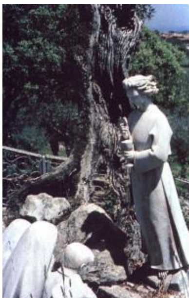
Sousoší v Sobecu, znázorňující zjevení Anděla míru a tři pasáčky

Ve Fatimě Svatá Panna světila dětem závažné "Tajemství", které sestává ze tří částí. První částí je vidění pekla a pekelných muk; modernímu člověku má důrazně připomenout, že ďábel a peklo skutečně existují, že to nejsou pouhé pohádkové představy pro děti. Druhá část pozůstává z proroctví o vývoji událostí po první světové válce, o Rusku a o druhé světové válce; byla zveřejněna papežem Piem XII. v r. 1942.