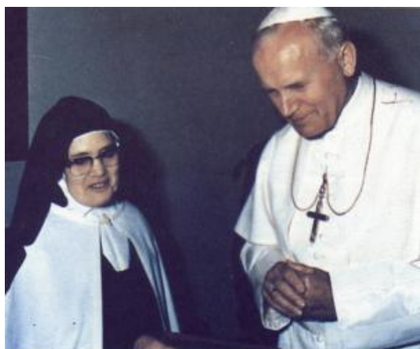
Sestra Lucie Santos a Svatý otec Jan Pavel II. (1982)

Na přechodu z druhého do třetího tisíciletí se Jan Pavel II. rozhodl zveřejnit text třetí části ‚fatimského tajemství‘. Po dramatických a krutých událostech XX. století, jednoho z nejkritičtějších v lidských dějinách, které vyvrcholilo krvavým atentátem na ‚sladkého Krista na zemi‘, se tak odhaluje skutečnost, která vytváří dějiny, a do hloubky je vysvětluje na základě duchovní dimenze, k níž je současná mentalita, často prosáklá racionalismem, hluchá. Dějiny jsou protkány zjeveními a nadpřirozenými znameními, která přímo vstupují do lidského života, provázejí putování světa a překvapují věřící i nevěřící. Tyto úkazy, které