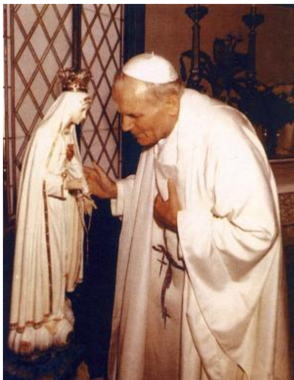
V papežově soukromé kapli ve Vatikánu

"A proto, ó Matko lidu a národů, Ty, která znáš všechno lidské utrpení a všechny lidské naděje, Ty, která s mateřskou láskou vnímáš všechny boje mezi dobrem a zlem, světlem a tmou, které otrásají současným světem, přijmi naše volání, kterým se silou Ducha svatého obracíme přímo k Tvému srdci: obejmi láskou Matky a Služebnice Páně tento náš lidský svět, který Ti svěřujeme a zasvěcujeme, plni starostí o pozemský a věčný úděl lidí a národů. Zvláště pak Ti svěřujeme a zasvěcujeme ten lid a ty